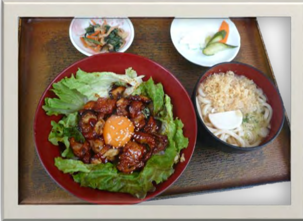
寿老人御膳 1240 円 1240 엔