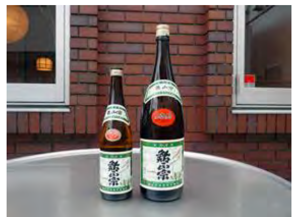
鮎正宗一合 600 円 아유 정종 1합 600 엔