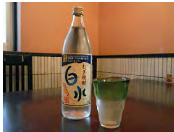
白水焼酎グラス1杯 550 円 하쿠스이 소주 1잔 550 엔