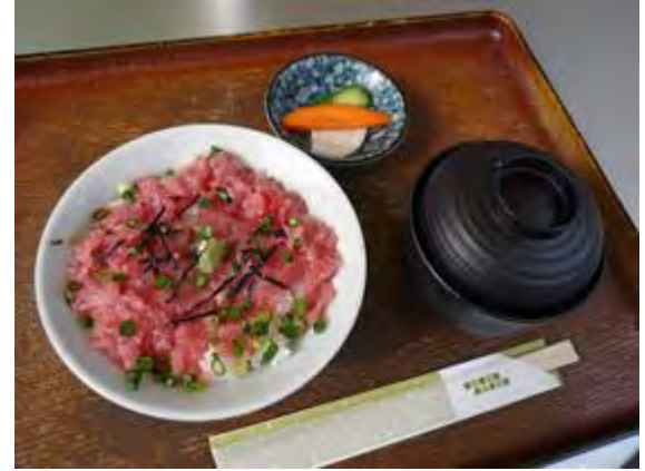
一品ネギトロ御飯 600 円 단품 파다랑어 정식 600 엔