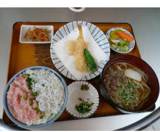
福祿寿 1080 円 후쿠로쿠주 1080 엔