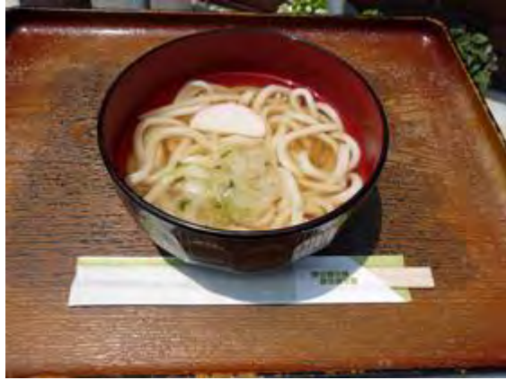
小うどん 250 円 미니우동 250 엔