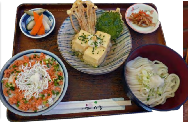
天晴御膳 900 円 감사의 마음 정식 900 엔