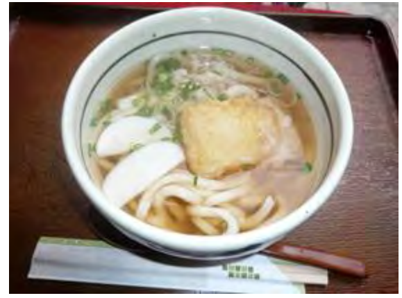
大黒うどん 550 円 다이코쿠 우동 550 엔