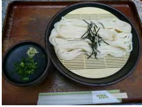
小ざる 350 円 미니 대발우동 350 엔