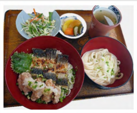
弁財天 1500 円 벤자이텐 1500