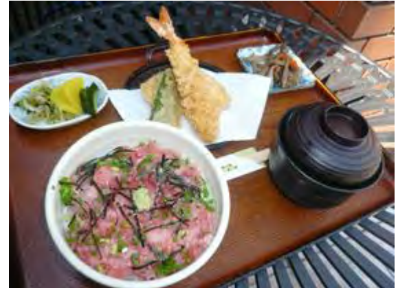
小町御膳 890 円 고마치 정식 890 엔