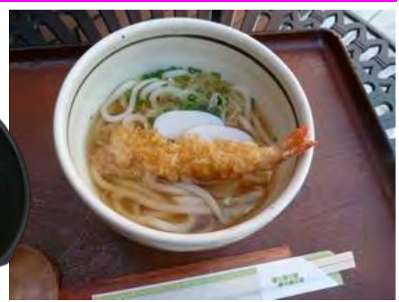
湖上うどん 550円 호상 우동 550 엔