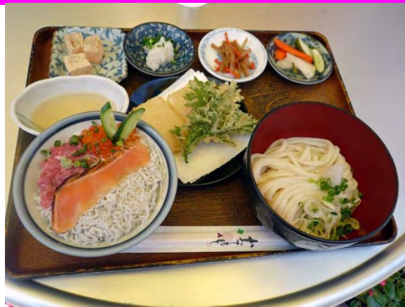
おかげさま御飯 1240 円 덕분에 감사 정식 1240 엔