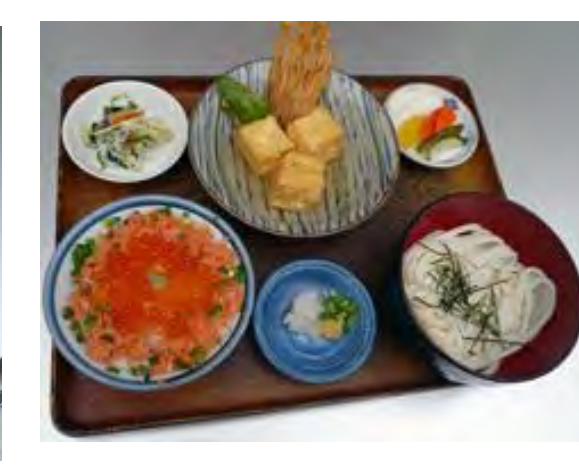
多聞天御膳 1240 円 다문텐 정식 1240 엔