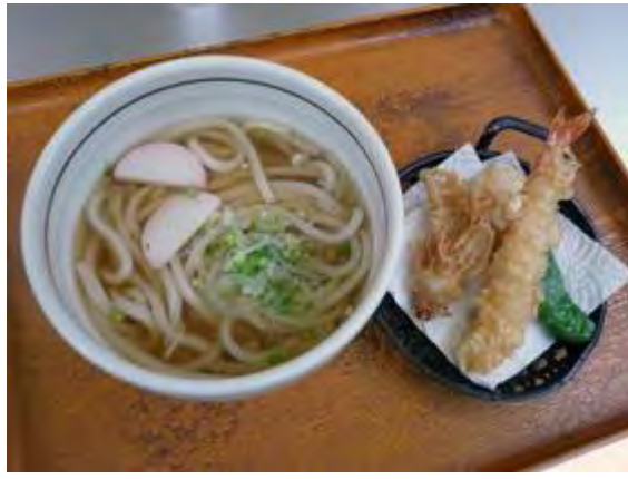
天ぷらうどん 780 円 덴푸라 우동 780 엔