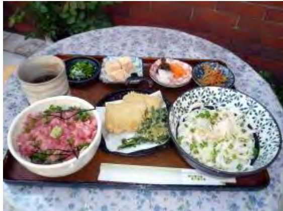
ツイてる御膳 1,030 円 운이 따라오는 정식 1,030 엔