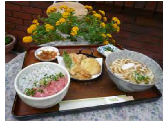
イケてる御膳 900 円 꽃꽂이 정식 900 엔