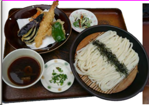
帝釈天ざる 1030 円 덴푸라 대발우동 1030 엔