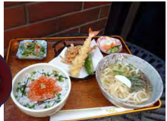
安心御膳 1030 円 안심 정식 1030 엔