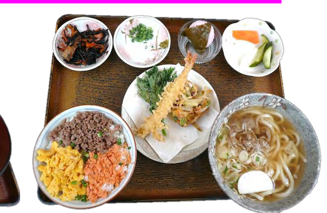
恋桜御膳 1080 円 1080 엔