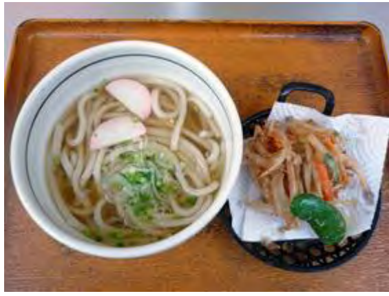
かき揚げうどん 780 円 야채튀김 우동 780 엔