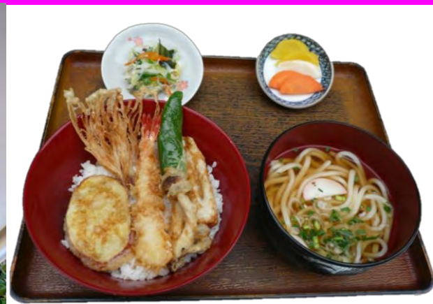
朱雀天御膳 980 円 980 엔