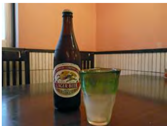
キリンビール中瓶 650 円 기린맥주 중 650 엔